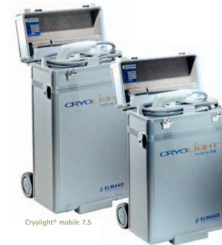
Cryolight® mobile 7.5