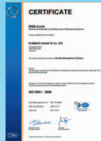
DIN EN ISO 9001:2008

CRYOLIGHT® ist geprüft und zertifiziert: