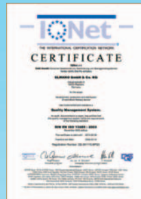
DIN EN ISO 13485:2003